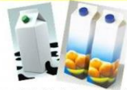
Briques de lait, de jus de fruit, de soupe