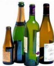
Bouteilles sans bouchons ni capsules